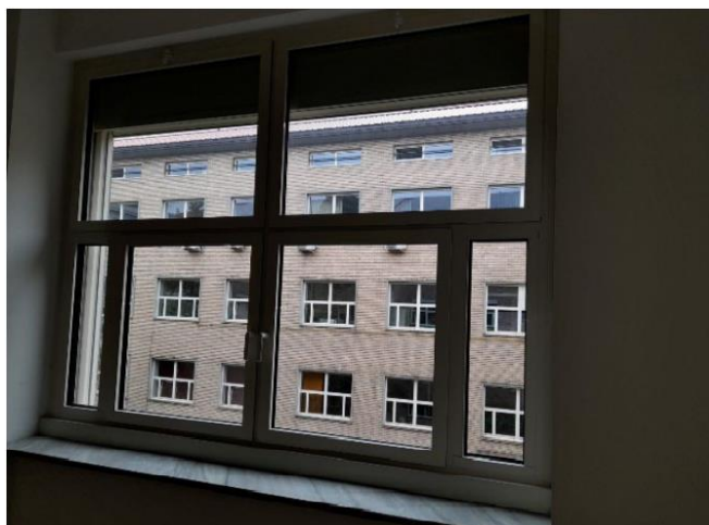
Figura 3 - Foto INFISSO TIPO 2

Nei locali uso ufficio dovranno essere posizionate 2 tende a rullo per ogni infisso. Le tende a rullo dovranno essere complete di sistema di ancoraggio a muro o a soffitto.