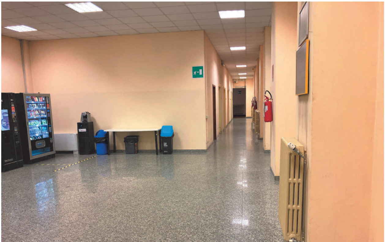
FOTOGRAFIA 4' - Area stampanti