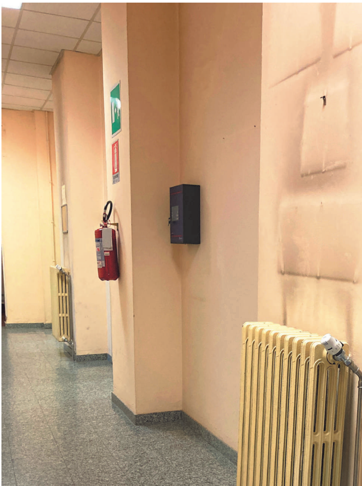
FOTOGRAFIA 6 - Corridoio area amministrativa (quadro allarme)