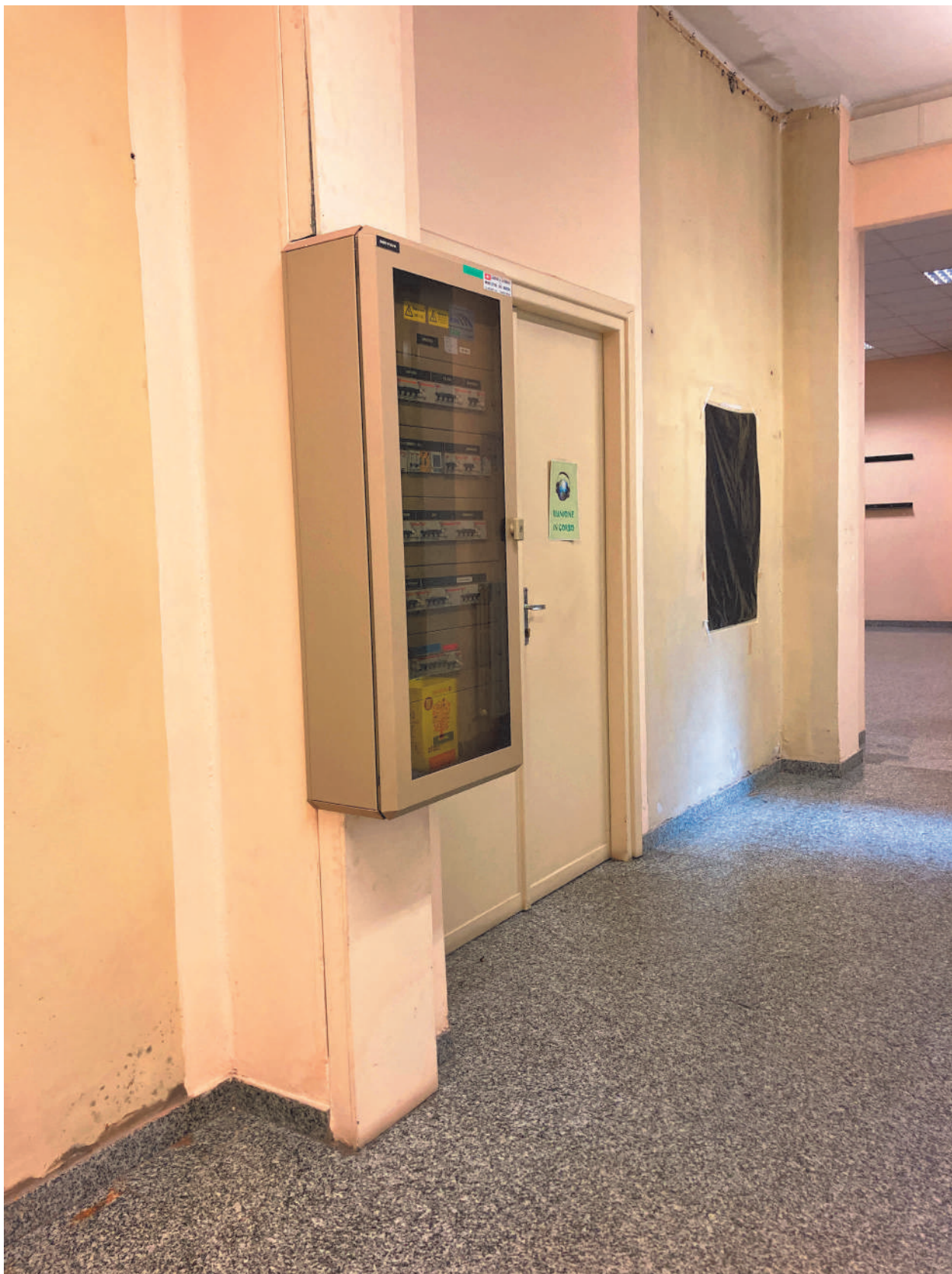
FOTOGRAFIA 2 - Quadro elettrico ( Area amministrativa)