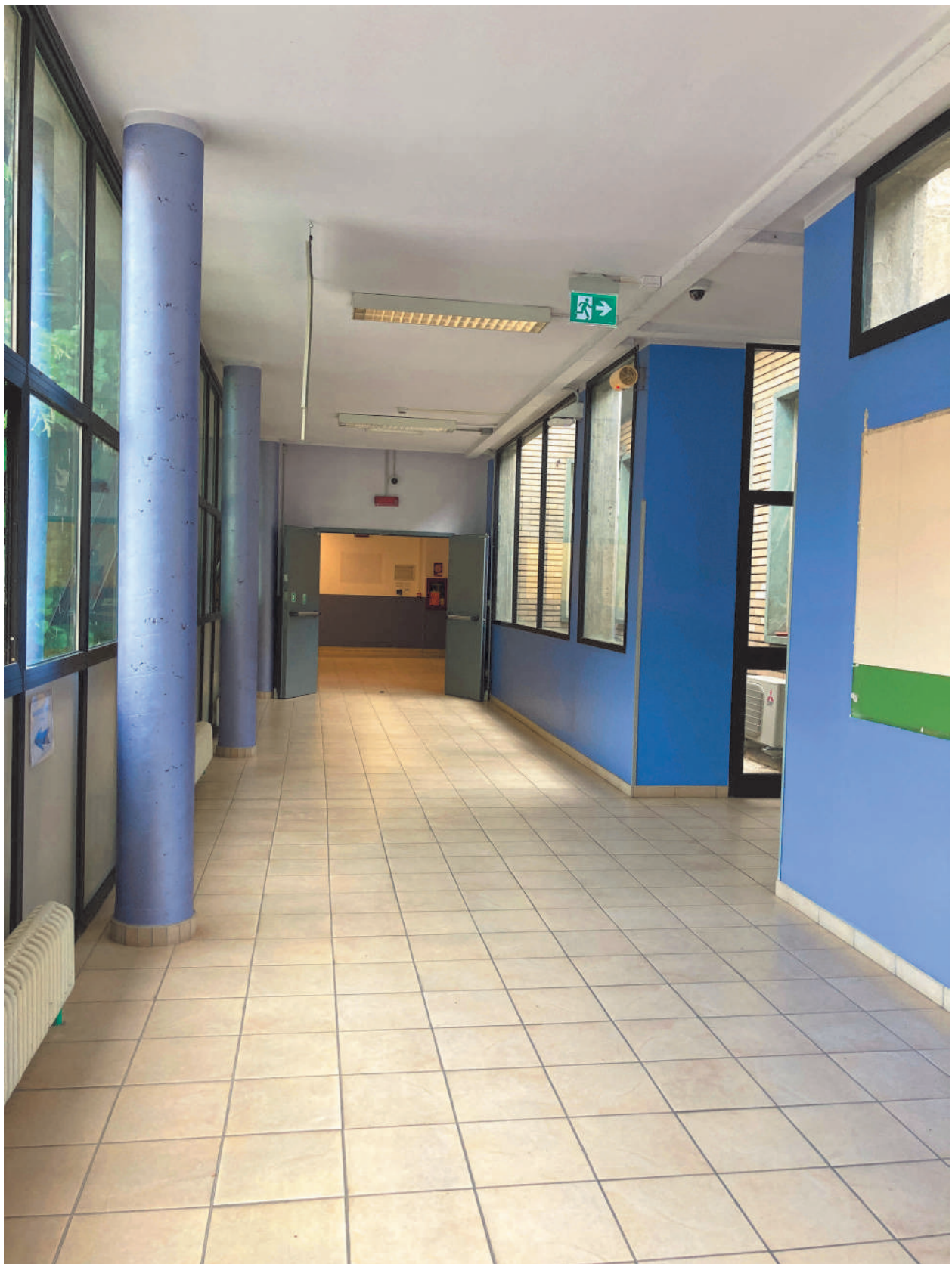
FOTOGRAFIA 9 - Corridoio d'ingresso