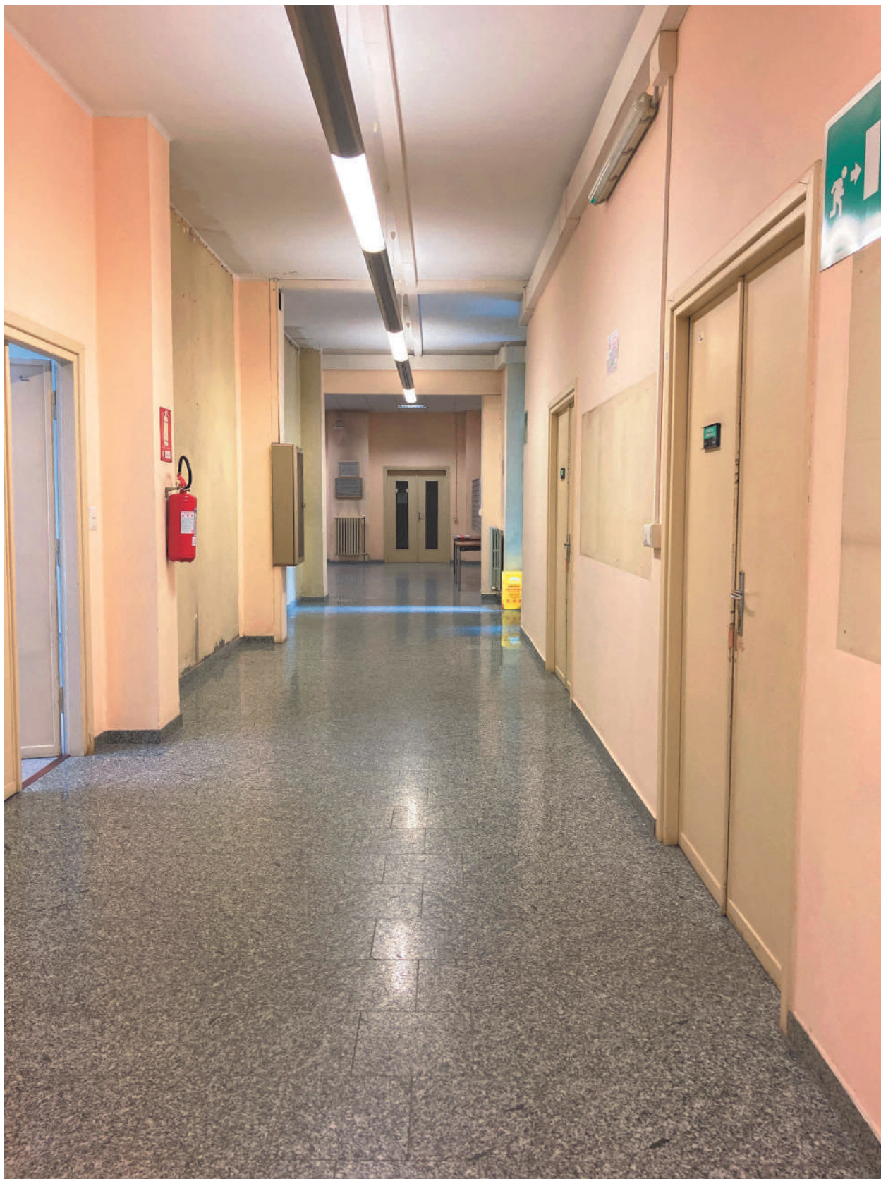
FOTOGRAFIA 1 - Area amministrativa