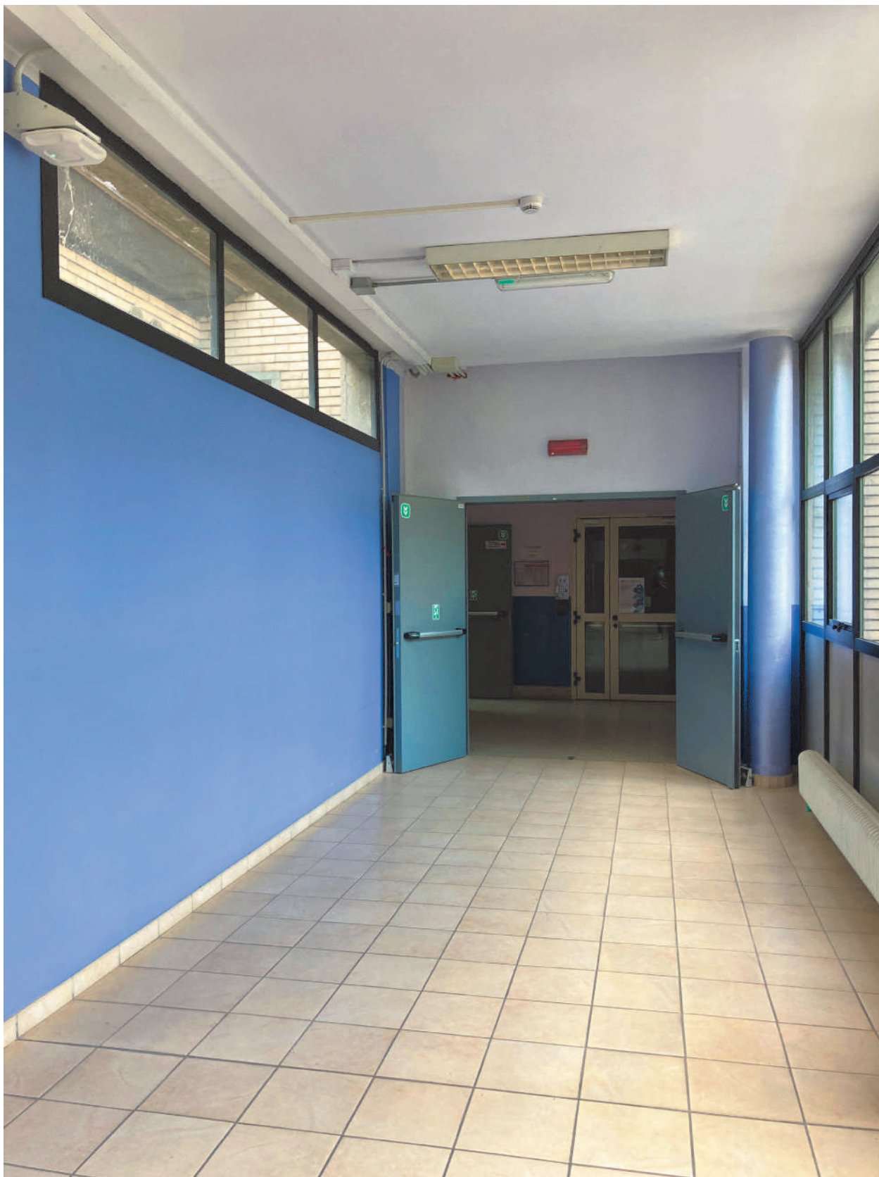
FOTOGRAFIA 10 - Corridoio d'ingresso