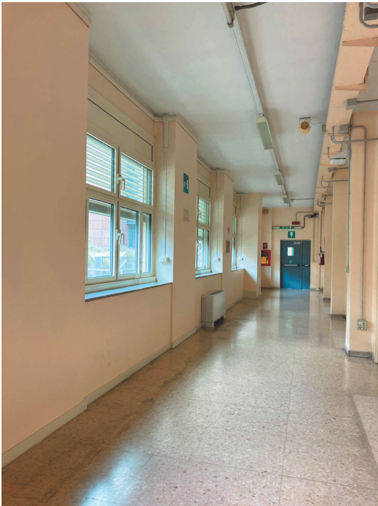
FOTOGRAFIA 8 - Corridoio uffici insegnanti