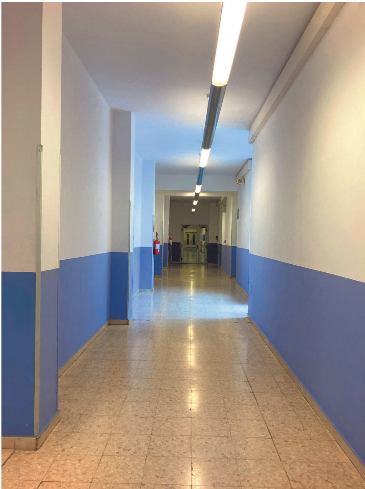
FOTOGRAFIA 11 - Corridoio aule studenti