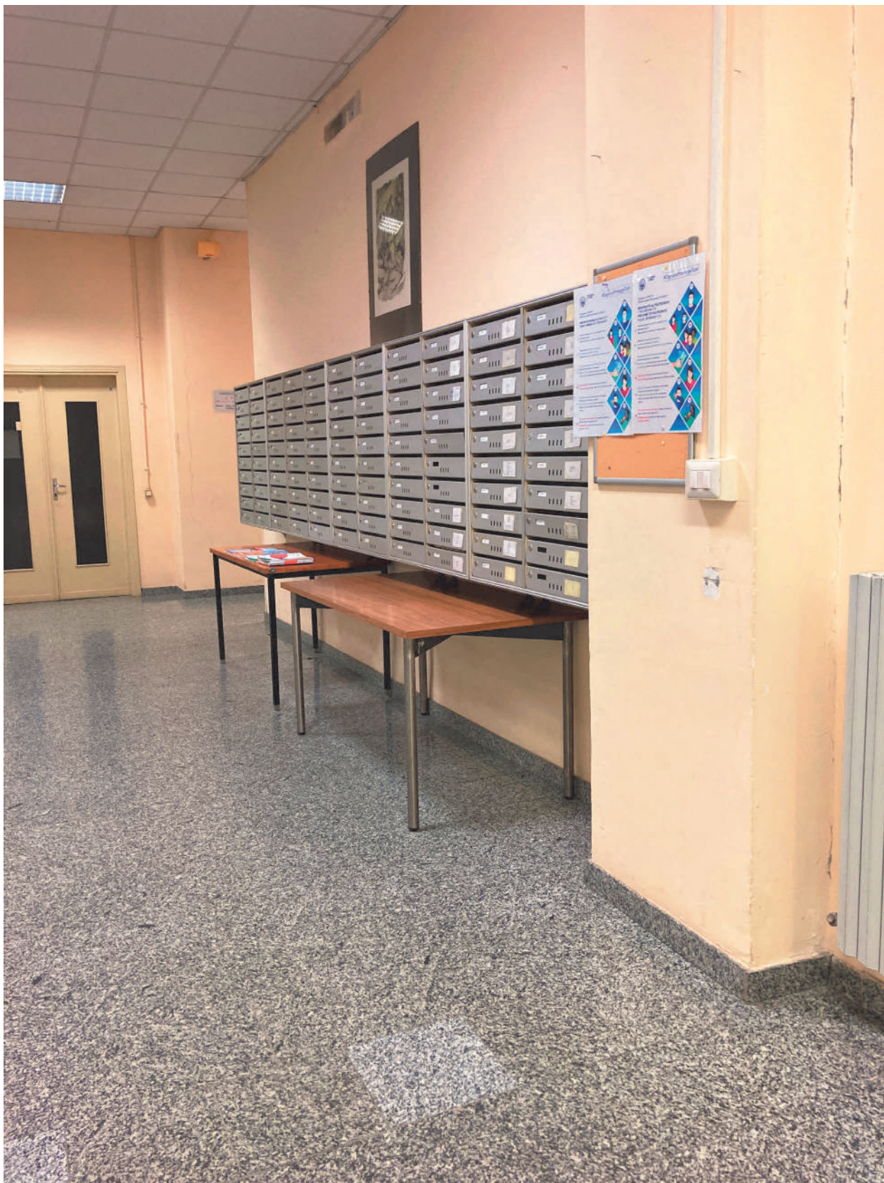
FOTOGRAFIA 3 - Cassetta delle lettere (Area amministrativa)