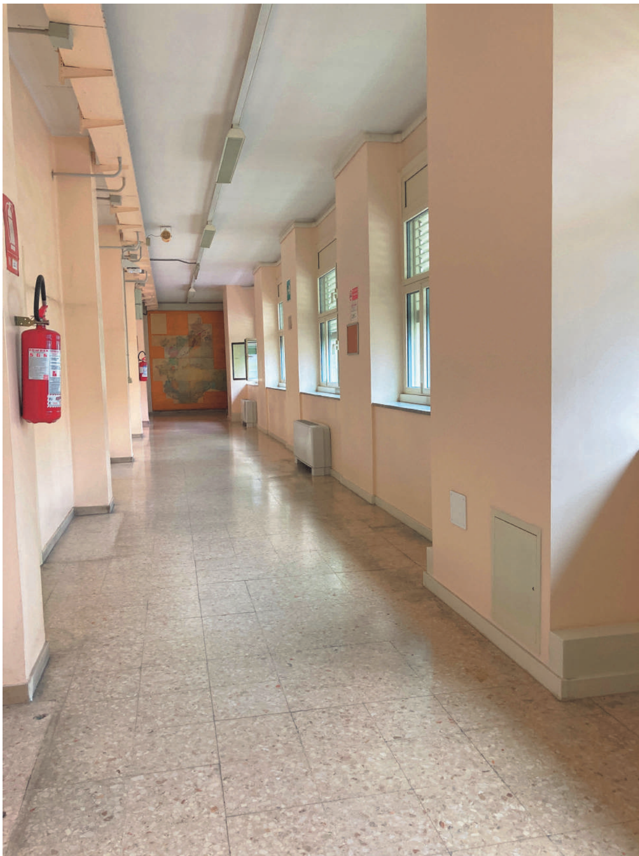
FOTOGRAFIA 7 - Corridoio uffici insegnanti