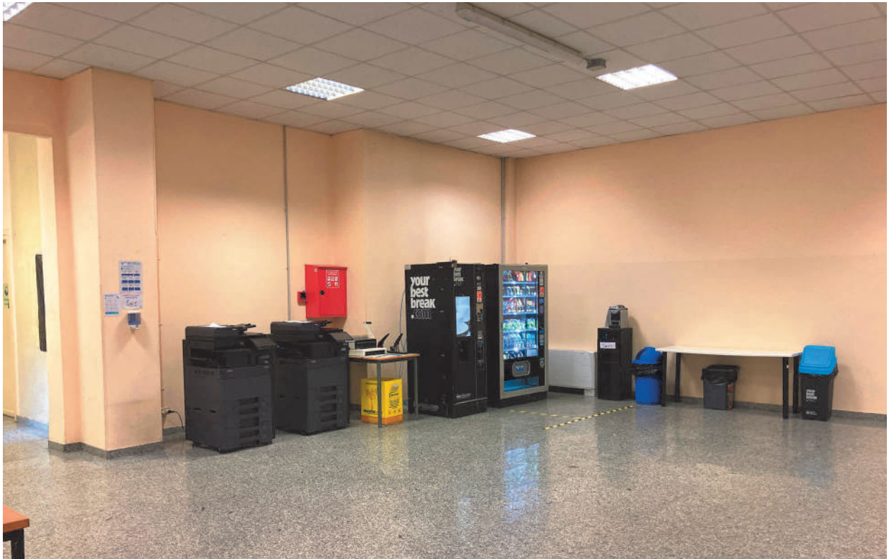
FOTOGRAFIA 4 - Area stampanti