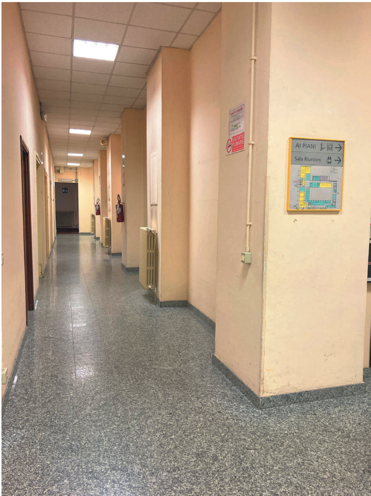
FOTOGRAFIA 5 - Corridoio area amministrativa